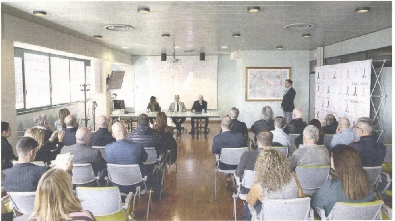
PRESENTAZIONE Ieri sono stati svelati i diversi appuntamenti che dall'1 dicembre al 7 gennaio animeranno Jesolo per il Natale