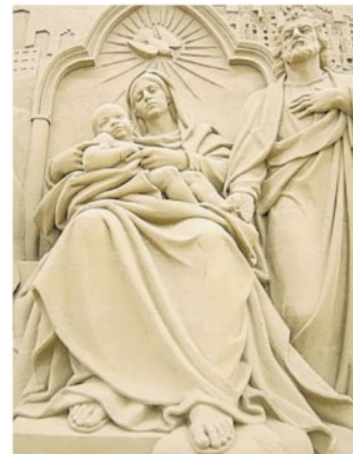
Un'immagine del Sand Nativity