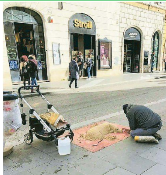
Sculture di sabbia sulle strade della capitale